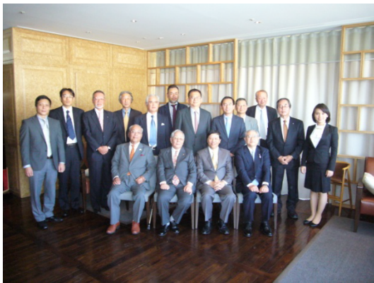
クオン大使と共に

7月に着任されたグエン・クオック・クオン駐日ベトナム特命全権大使が来阪され 10月19日に協会幹部を昼食会に招待いただきました。クオン駐日大使は「日本とベトナムの友好関係の強化に向け協会と連携して努力したい」と挨拶され西村会長をはじめ協会幹部と和やかに懇談しました。