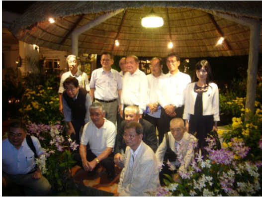
クオン会長と共に