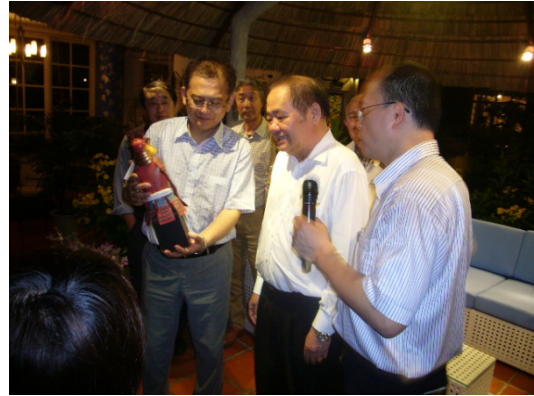
築野副団長とクオン会長