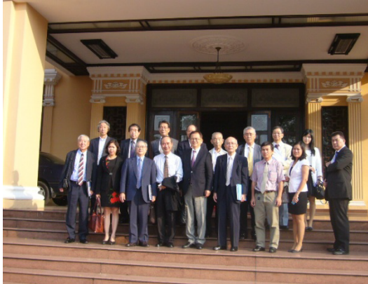
フエ省人民委員会と共に