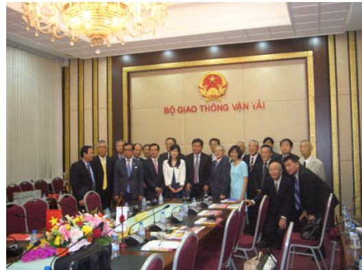
タン交通運輸大臣と共に