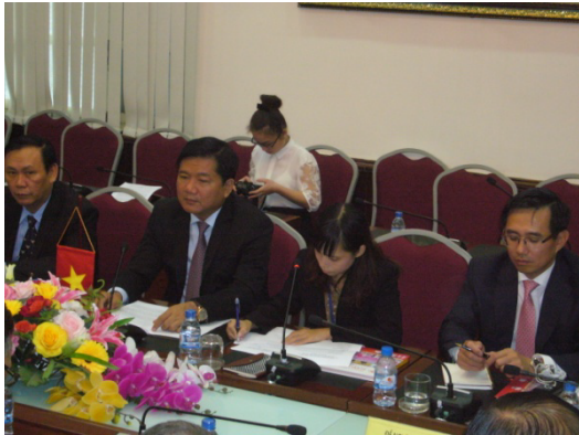
タン交通運輸大臣 ビン総領事