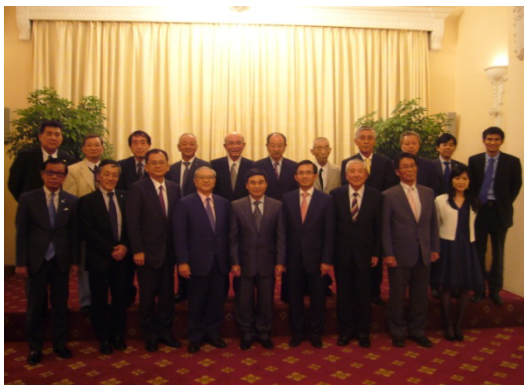
ソン副外務大臣と共に