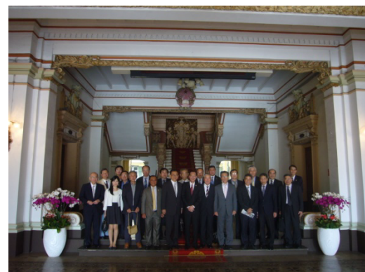
リエム副市長と共に