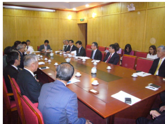
投資計画省外国投資庁ホアン長官との会談の様様