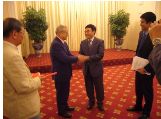
西村団長とソン副外務大臣