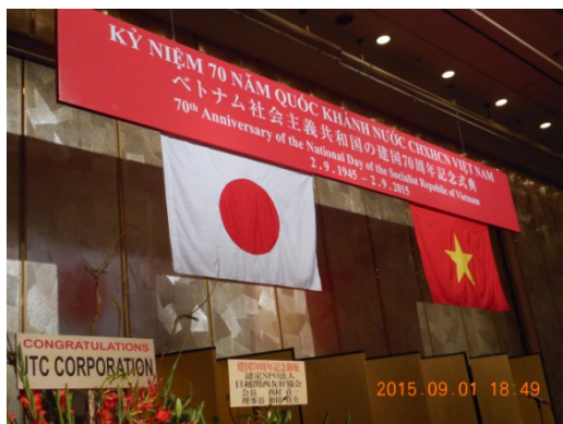
建国 70 周年会場