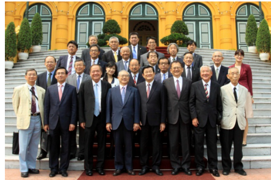
サン国家主席と共に