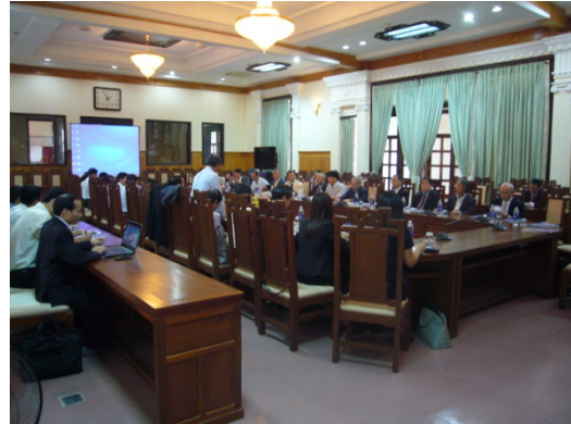
フエ省人民委員会との会談の様様