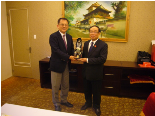
築野副団長とフエ省人民委員会カオ委員長